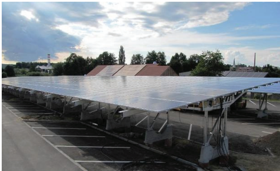
Bild 2: Standort des Bürgersolkraftwerks „P&R Parkplatz Bahnhof Pfaffenhofen a.d. Ilm“

Durch die Testläufe kann es bis zu drei Monate dauern, bis die laufenden Erträge im Internet freigeschaltet werden.